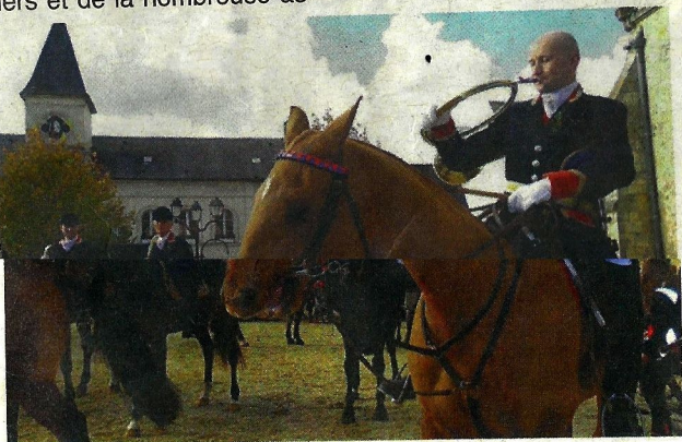
Le piqueux sonne le départ de la chasse au flanc de l'église.