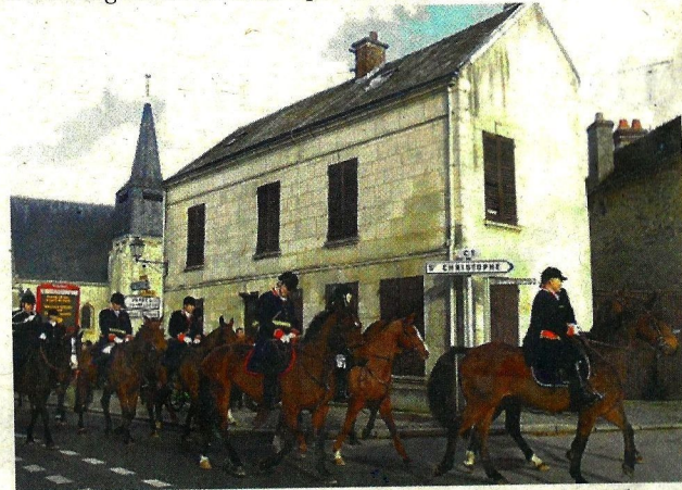
L'équipage prend la direction de la forêt pour une chasse qui durera jusqu'à la fin de l'après-midi.