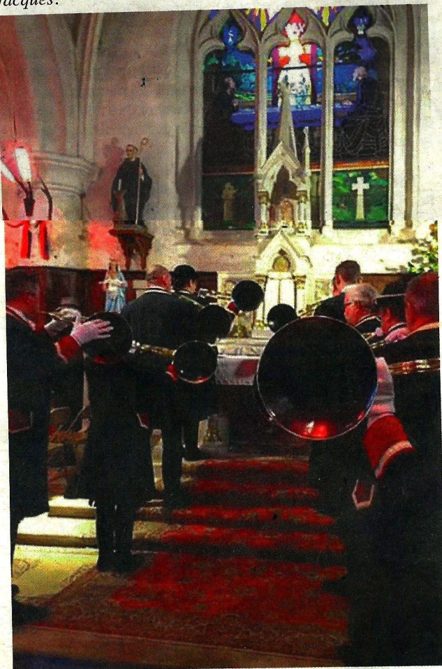
La messe de Saint-Hubert est ponctuée des sonneries de trompes de chasse.