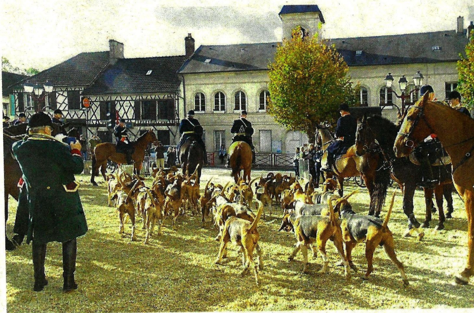
La meute quitte la place, le flair aiguë et les autres sens aux aguets : la chasse de la Saint-Hubert commence. Il est midi passé.

Singer Senlis 38, avenue Foch - 60300 Senlis